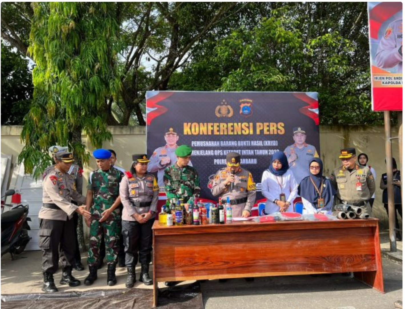
Kapolres Banjarbaru Bersama Dandim Banjar Musnahkan Ribuan Miras dan Ratusan Knalpot Brong di Kota

BANJARBARU - Ribuan minuman keras (miras) dan ratusan knalpot brong dari